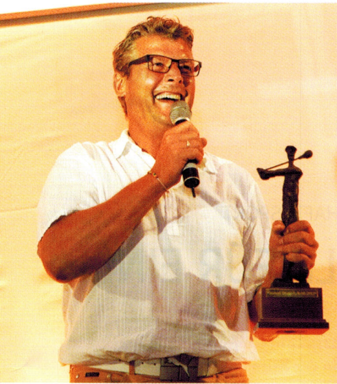
Verteidigte seinen Titel: Präsident Nobby Dickel

27HOLE GOFUS CHAMPIONSHIP IN HAMBURG-TREUDELBERG