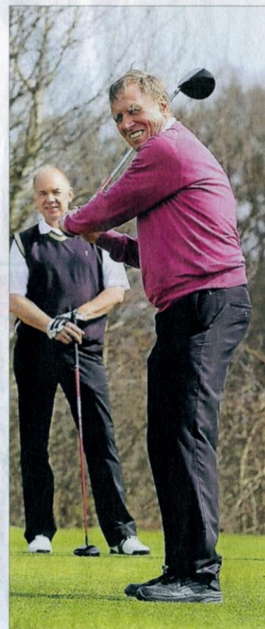
Das Runde muss in das Runde: Beim Benefiz-Golfturnier auf der Anlage in Schermbeck-Weselerwald machten die Ex-Fußballprofis Olaf Thon, Thomas Brdaric und Sigggi Held (v.l.) gestern eine gute Figur.